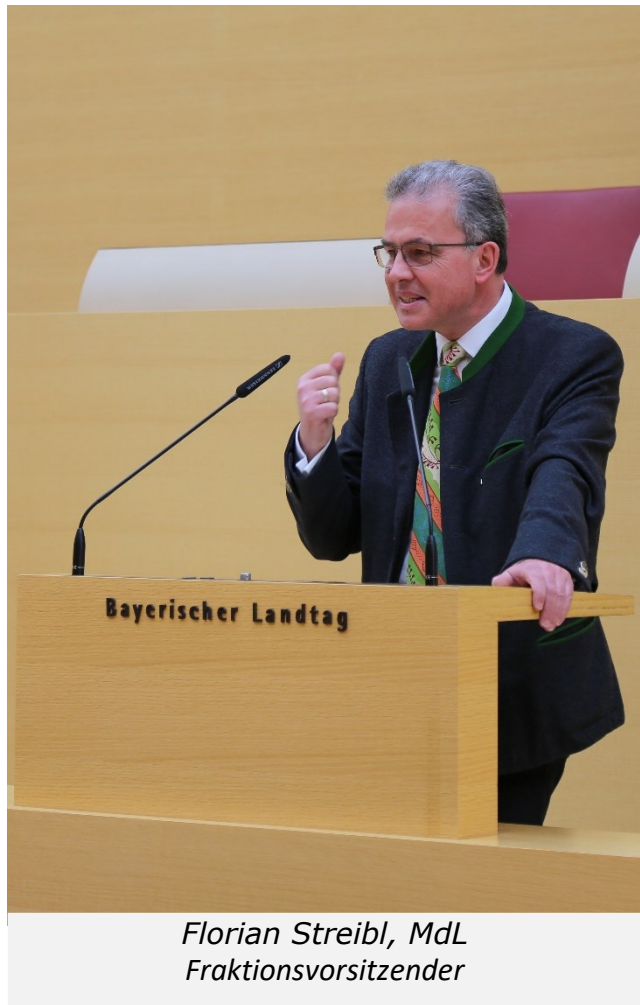
Florian Streibl, MdL Fraktionsvorsitzender

nach und nach kehrt eine „neue Normalität“ in unser aller Leben ein und wir lernen schrittweise, mit der Gefahr des Coronavirus zu leben. Anfang der Woche trat in Bayern eine Maskenpflicht im ÖPNV und allen Geschäften in Kraft, zusätzlich dürfen wieder alle Geschäfte öffnen, müssen aber ihre Verkaufsfläche auf 800m 2 begrenzen. Ergänzend dazu verlängerte die Staatsregierung die Ausgangsbeschränkungen bis zum 11. Mai 2020 . Noch ist die Gefahr einer zweiten Infektionswelle groß – diese würde wahrscheinlich flächendeckend statt punktuell auftreten und deshalb erheblich mehr Schaden in Wirtschaft und Medizinwesen anrichten. Doch das immer frühlingshaftere Wetter lässt natürlich auch den Corona-Lagerkoller vieler Menschen anwachsen. Es gilt mindestens noch eine weitere Woche mit Ausgangsbeschränkungen zu überstehen: Bitte halten Sie durch und bleiben Sie gesund!