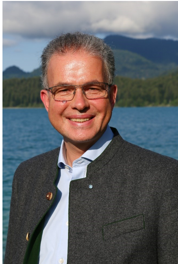
Florian Streibl, MdL Fraktionsvorsitzender

diese Woche hat unsere Staatsregierung nochmals weitere Lockerungen verkündet : Seit dem 17. Juni ist der Katastrophenfall beendet und Treffen mit bis zu zehn Personen sind wieder erlaubt. Ab 22. Juni dürfen Hallenbäder, Thermen und Wellnessbereiche öffnen, die Gastronomie darf bis 23 Uhr Gäste bewirten und in Geschäften nun ein Kunde pro 10m 2 Verkaufsfläche einkaufen – eine Verdoppelung der möglichen Kundenanzahl. Kunst- und Kulturbetriebe empfangen wieder bis zu 100 Besucher in geschlossenen Räumen und bis zu 200 Gäste im Freien. Veranstaltungen aller Art, wie beispielsweise Hochzeiten, können nun mit 50 Personen innen sowie 100 Besuchern im Freien abgehalten werden. Zu guter Letzt werden dieselben Regeln bei Busreisen wie im ÖPNV implementiert: ein Mindestabstand ist nicht mehr erforderlich, allerdings gilt eine Maskenpflicht – eine sinnvolle Lösung, um auch Busunternehmen nach der Krise zu stärken. Wir FREIE WÄHLER im Landtag sind froh, dass wir unsere Forderungen innerhalb der Koalition durchsetzen konnten und so mehr Lockerungen als ursprünglich geplant möglich wurden.