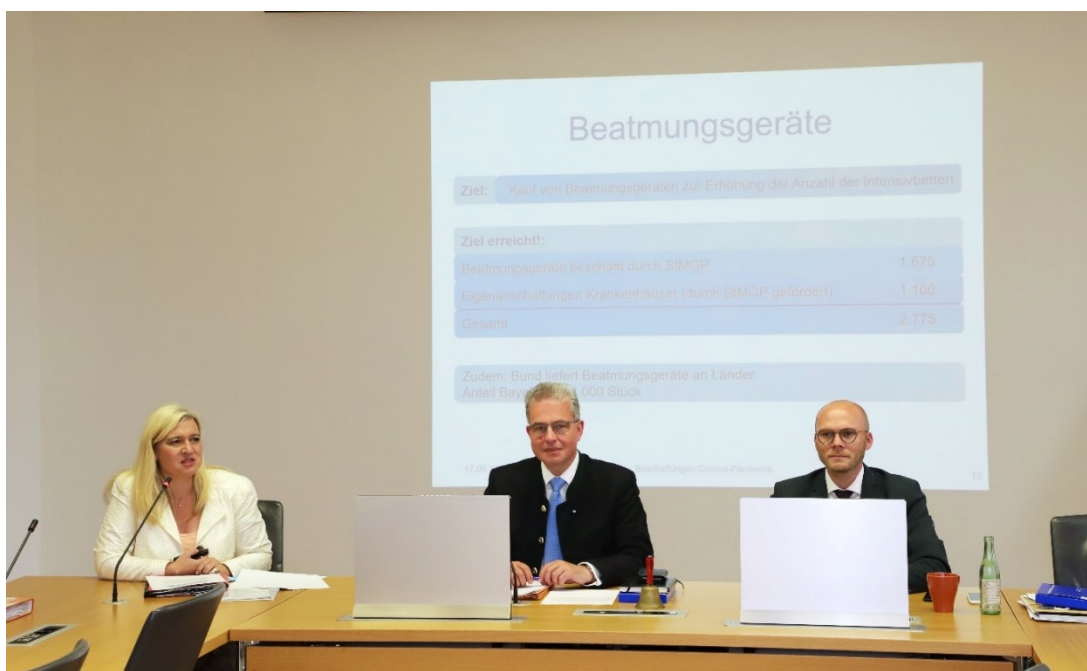
Gesundheitsministerin Huml zu Besuch in der Fraktionssitzung

Beschäftigt hat uns diese Woche im Maximilianeum ein Dringlichkeitsantrag, den wir bereits vor Pfingsten eingereicht hatten. Wir FREIE WÄHLER im Landtag wollen darin die Unternehmensbesteuerung modernisieren . Denn gerade in Zeiten wirtschaftlicher Nachwehen der Corona-Krise ist es dringender denn je geboten, Unternehmen mit Steuersenkungen wirksam zu entlasten. Mit rund 30 Prozent erhebt Deutschland im Vergleich zu anderen EU- und OECD-Staaten einen der höchsten kombinierten Steuersätze für Kapitalgesellschaften. Daher bedarf es nun eines steuerpolitischen Maßnahmenpakets der Großen Koalition in Berlin, um den Wirtschaftsstandort Deutschland deutlich aufzuwerten . Doch nicht nur Kapitalgesellschaften haben wir als Landtagsfraktion im Blick, sondern auch weitere steuerpolitische Felder: So wollen wir mit der schnellen und vollständigen Abschaffung des Solidaritätszuschlags die Binnenkonjunktur und mit Reformen im Außensteuerrecht sowie bei Abschreibungen die Liquidität von Unternehmen stärken. Der von Bundesfinanzminister Scholz groß angekündigte „Wumms“ zur Ankurbelung der Wirtschaft darf sich nicht auf kurzfristige staatliche Konjunkturspritzen beschränken, sondern muss in langfristige Steuerreformen münden. Nur so wird unsere Wirtschaft wieder krisenfest.“