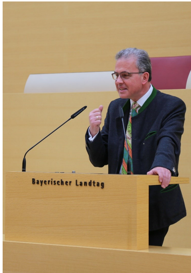
Florian Streibl, MdL Fraktionsvorsitzender

am Mittwoch dieser Woche wurde in Berlin die bundesweite „Notbremse“ mit einer Ergänzung des Infektionsschutzgesetzes im Bundestag beschlossen. Wir kritisieren diese Verlagerung der Kompetenzen zum Bund hin. Durch die Anhörung von Rechtsprofessoren und Experten im Verfassungsausschuss des Bayerischen Landtags am 22. April sehen wir uns einmal mehr in unserem bisherigen Kurs bestätigt: So hat die Mehrheit der geladenen Experten eine Kompetenzverlagerung der Anti-Corona-Politik an den Bund zur Schaffung bundeseinheitlicher Regelungen auch im Hinblick auf den Verhältnismäßigkeitsgrundsatz kritisch gesehen.