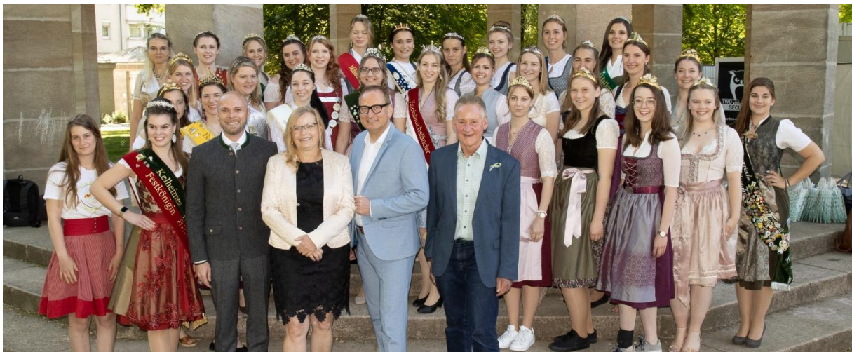
Königinntag 2022 in Fürth.