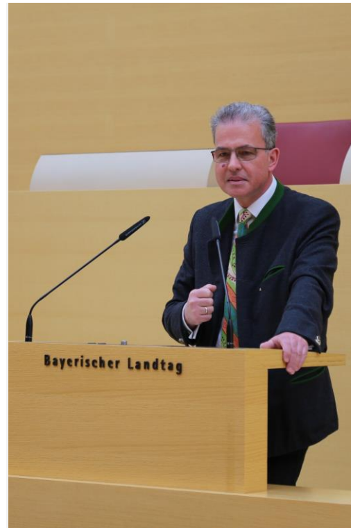
Florian Streibl MdL Fraktionsvorsitzender

neben dem unfassbaren menschlichen Leid verschärft der russische Angriffskrieg auch wirtschaftliche Unsicherheiten. Die globalen Folgen sind nur schwer abzuschätzen: Rohstoffpreise auf Rekordhöhe, gestörte Lieferketten und drohende Engpässe bei der Energieversorgung. Insbesondere die Auswirkungen der Energiekrise sind auch hier in Bayern spürbar: Gesundheitseinrichtungen, Krankenhäuser sowie Rehabilitations- und Pflegeeinrichtungen stehen vor nie dagewesenen Herausforderungen. In der aktuellen Debatte über Soforthilfen für Gesundheitseinrichtungen fordern wir FREIE WÄHLER im Landtag daher eine Energiekostenzulage für Kliniken und Praxen, damit in unseren Gesundheitseinrichtungen nicht