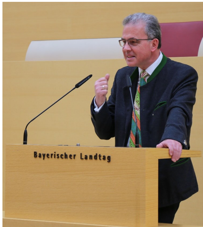
Florian Streibl, MdL Fraktionsvorsitzender

zu 5.000 Euro pro Haushalt gewähren. Zudem werden für Ölschäden an Wohngebäuden bis zu 10.000 Euro bereitgestellt. Auch für Unternehmen und Angehörige freier Berufe sowie für die Land- und Forstwirtschaft stehen Soforthilfen zur Verfügung.