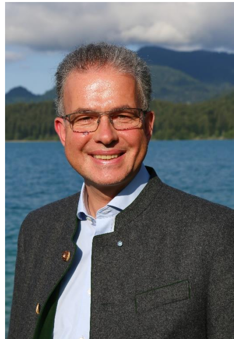
Florian Streibl, MdL Fraktionsvorsitzender

nach der parlamentarischen Sommerpause ist die FREIE WÄHLER Landtagsfraktion am vergangenen Mittwoch in ihre dreitägige Klausur im schwäbischen Nördlingen gestartet. Die Themen auf der Tagesordnung waren dabei so vielfältig wie herausfordernd: Wie kann eine unabhängige Energieversorgung Bayerns hergestellt und gesichert werden? Wie können angesichts explodierender Energie- und Verbraucherpreise Bayerns Bürger und Unternehmen stärker entlastet werden?