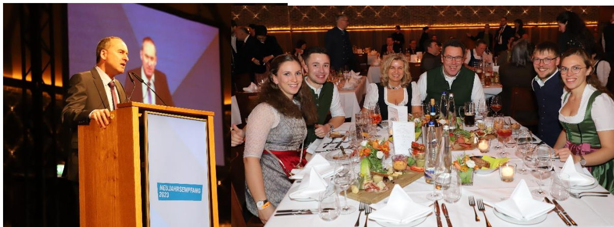
Bilder vom Neujahrsempfang 2023 der FREIEN WÄHLER Landtagsfraktion auf dem Münchner Nockherberg.

Wie wir FREIE WÄHLER im Landtag diese Themen jeden Tag tatkräftig angehen, lesen Sie auf den nächsten Seiten.