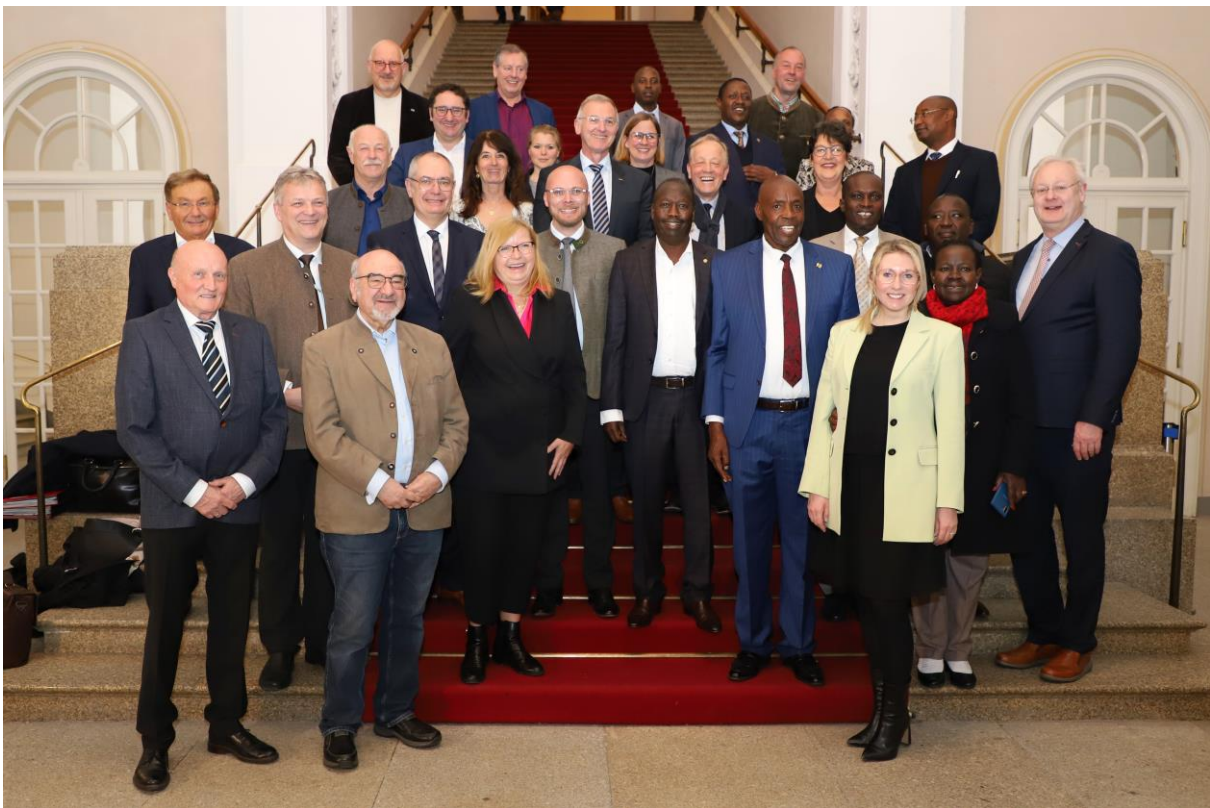
Abgeordnete der FREIE WÄHLER Landtagsfraktion beim Treff mit ihren Kollegen aus Nairobi in der Friedrich-Bürklein-Halle des Landtags.

Thematische Schwerpunkte waren unter anderem kommunale Klimapartnerschaften, Kooperationen im Bereich Wasserstoff und Zusammenarbeit in Bildungsfragen . HIER finden Sie ein Video vom Treffen.