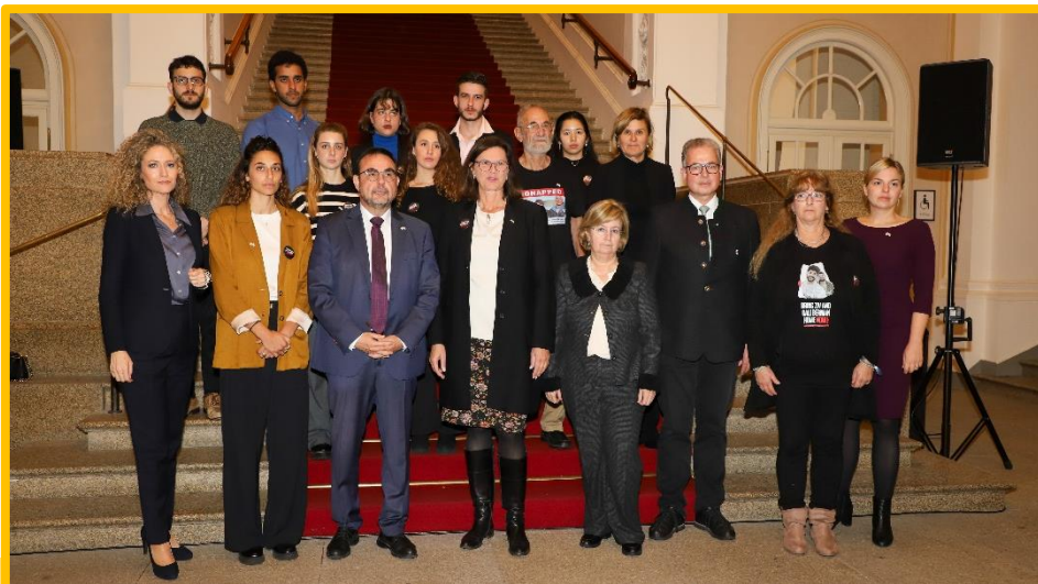
„Wir stehen fest an der Seite Israels!“. Das sagte Fraktionschef Florian Streibl bei einem Empfang von Angehörigen deutsch-israelischer Hamas-Geiseln im Landtag.