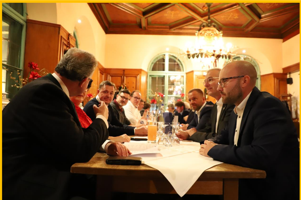
Informeller Austausch fernab des Hohen Hauses.

Auch wenn unsere Fraktion in den vergangenen Wochen bereits zahlreiche gemeinsame Sitzungen zu bestreiten und viele weitreichende Entscheidungen zu treffen hatte, gab es bislang kaum Gelegenheit für persönliche Gespräche. Das haben wir diese Woche nachgeholt. Die schönsten Bilder unseres „Teambuildings auf gut bairisch“ gibt's HIER .